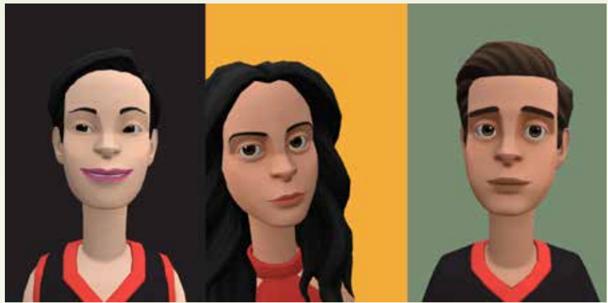
Bild ur spelet Reality Check