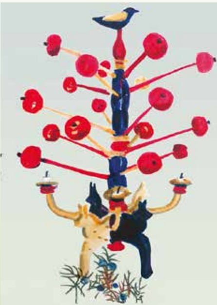
Julträd i Mångkulturella almanackan 2022. Bild Iréne Thisner som gjort alla bilder i den och även i kommande.

Olika träd har varit en del av julfirandet. Det vanligaste är julgranen som dekorerar på olika sätt. Men det finns också julträd som inte är julgranar, som julträdet i södra Sverige som går att läsa mer om i texten till december i almanackan. (Läs också om att bränna ek på julen!) Hur skulle ert julträd se ut? Skulle det vara en gran eller skulle det vara något annat? Kanske något av de olika träden som har diskuterats i almanackan under året. Eller skapar ni ett helt nytt träd? Kanske gör ni det träd som kommer att dekoreras i framtiden när vi firar jul. Ni kan antingen rita eller skapa era träd av olika material.