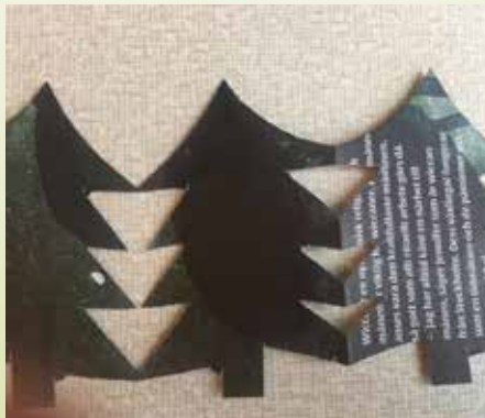
Återanvänd almanackan, klipp granar!

Övningen kommer från lärarhandledningen till Reality Check. Appen Reality Check är ett interaktivt spel för åldrarna 13-19 år om vardagsrasism som vill uppmuntra till civilturage. Det finns där appar finns.